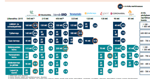
Kuva 110: Arvio toimialan suurimpien toimijoiden liikevaihdon jakaumasta ja markkinaosuudesta segmentteittäin